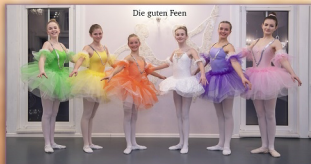
Die guten Feen