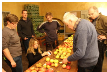
Weiterbildungsveranstaltung zur Streuobstbestimmung