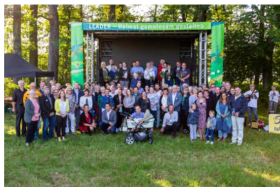
LEADER-Familie in Saale-Orla, LEADER PR-Projekt, 29. Juli 2021

Mit ca. 80 Teilnehmerinnen und Teilnehmern war die Veranstaltung sehr gut besucht.