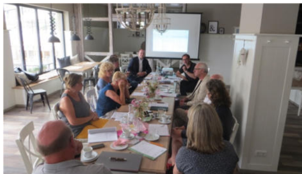
Sitzung von Vorstand und Fachbeirat im Café Ilse in Ranis

Die Sitzungen von Vorstand und Fachbeirat wurden wie in den vergangenen Jahren genutzt, um Projekte zu besuchen und auszuzeichnen. Insgesamt fanden fünf gemeinsame Sitzungen von Vorstand und Fachbeirat statt.